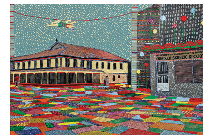
«Δάπεδο ασφαλείας», μεϊκτέ τεχνική σε ξύλο, 45x30εκ.