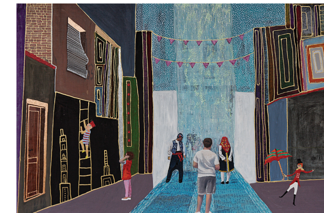
«Κομοτηνή μου Κόρη», μεϊκτέ τεχνική σε ξύλο, 70x45εκ.