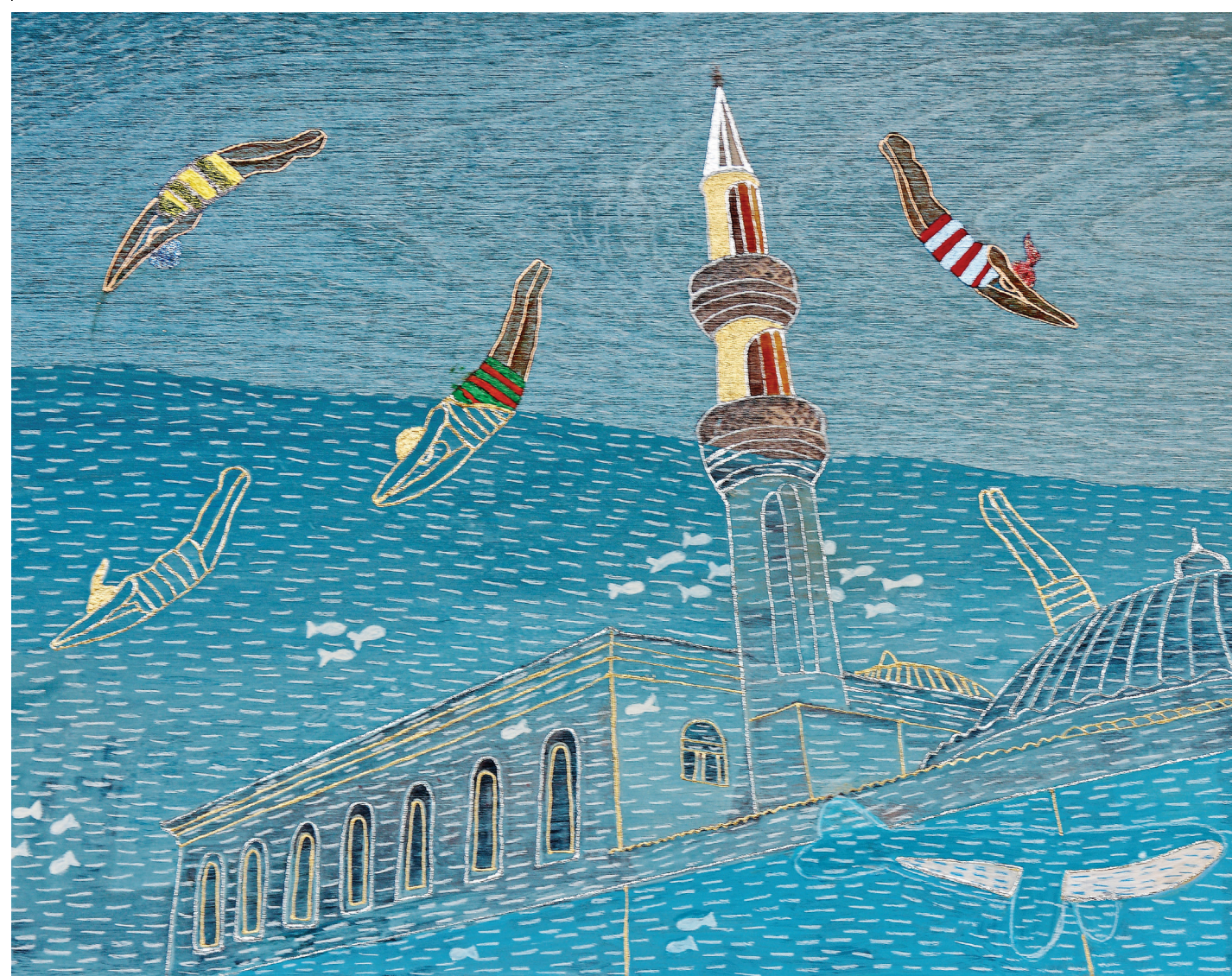
«Επουράνιο ενυδρείο», μεϊκή τεχνική σε ξύλο, 45x30εκ.