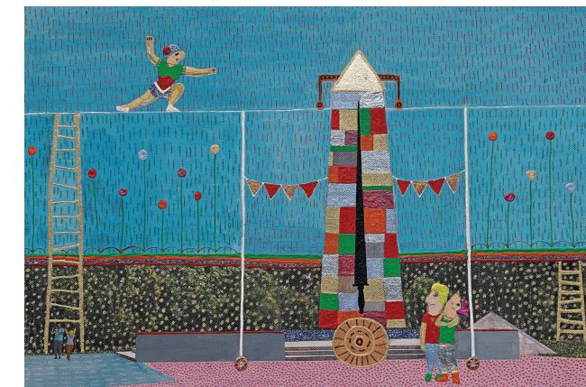
«Ακροβασία οριζόντων», μεϊκτέ τεχνική, 45x30εκ.

Μαρία Γιαγιάννου Συγγραφέας - Θεωρητικός τέχνης