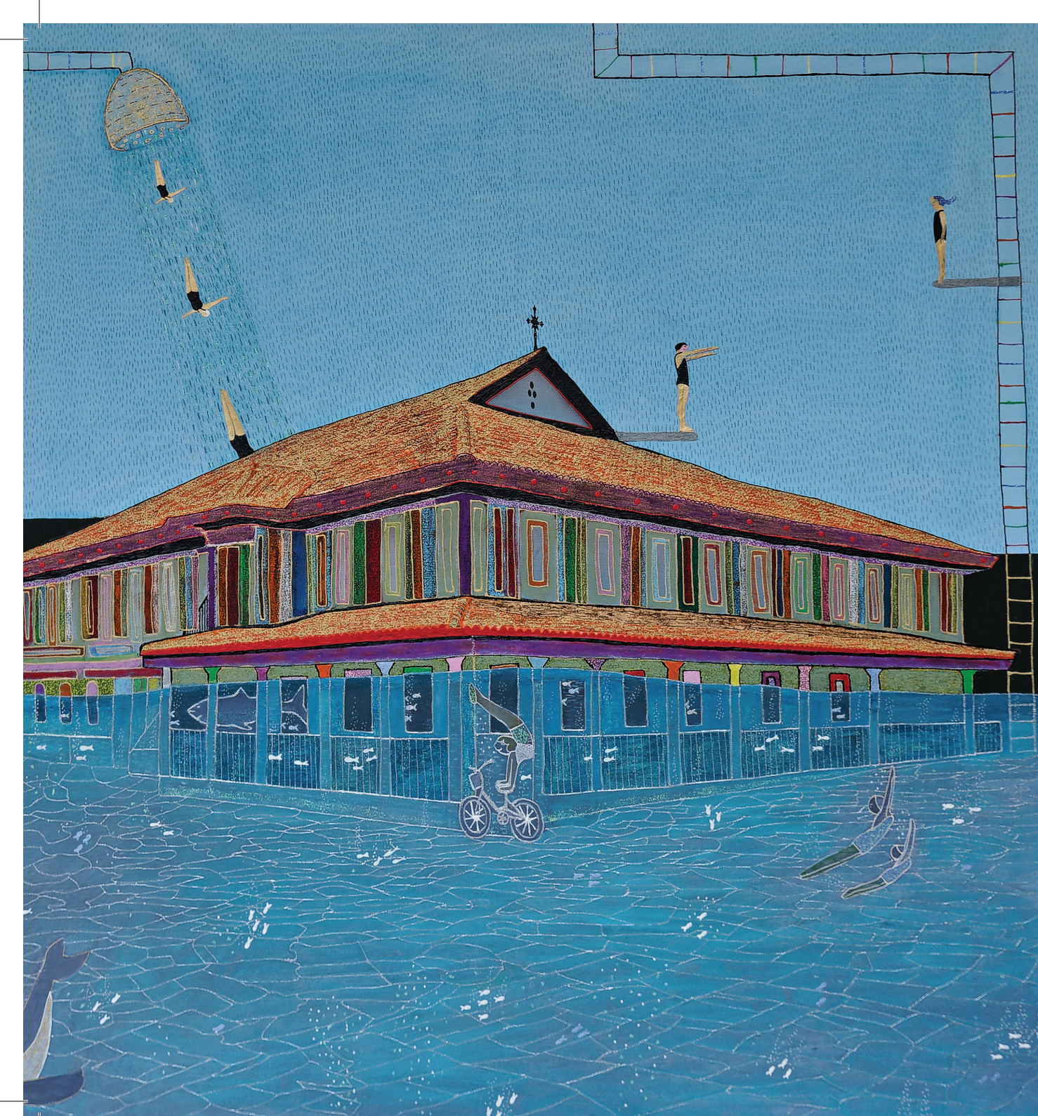
«Προσβαλίσωση στη λήθη του ποδηλάτου», μεϊκτέ τεχνική, 120x120εκ.