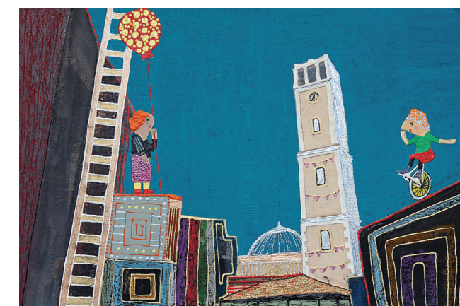
«Τικ-τοκ», μεϊκτέ τεχνική σε ξύλο, 45x30εκ.